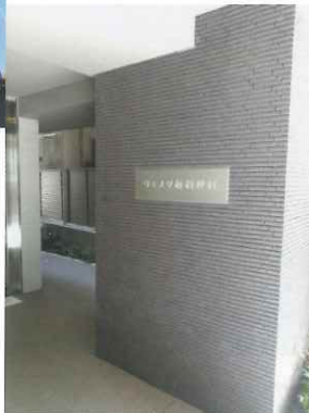
マンション棟エントランス