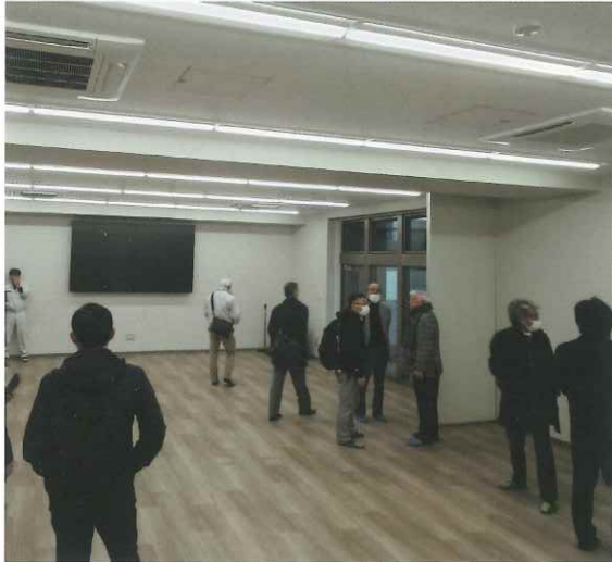
施主確認検査（3月22日の様子）