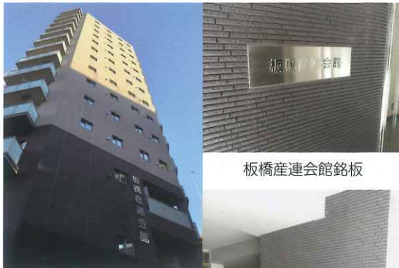
本町方面からの外観