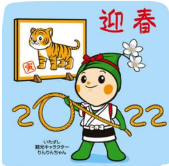
板橋区観光協会 りんりんちゃん年賀イラスト

令和4年の年明けにあたり、日頃より板橋区政に深いご理解とご協力を賜っております。板橋産業連合会の皆様にも、厚く御礼を申し上げますとともに、謹んで新年のご挨拶をさせていただきます。