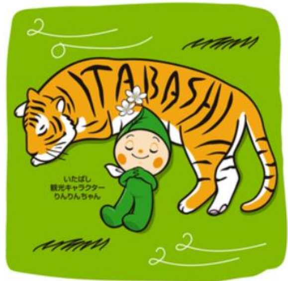
板橋区観光協会 りんりんちゃん年賀イラスト

今後も地域活性化や産業構造の革新のため、貴会のご協力をお願い申し上げますとともに、板橋産業連合会の益々のご発展と会員の皆様のご健勝を祈念いたしまして、新年のご挨拶とさせていただきます。