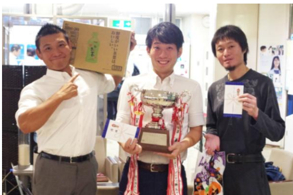
優勝した GIKODOZ チーム

第66回板橋産連ボウリング大会が9月27日（金）にトミコシ高島平ボウルにて行われました。5社10チームに参加いただき、熱戦の末 GIKODOZ チームが優勝されました。おめでとうございます。結果は以下の通りです。