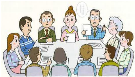
検察審査会 Q&A パンフレットより

各区市町村の選挙管理委員会が、選挙人名簿に登録された方の中から年 1 回検察審査員候補者となる方々を「くじ」で選んでいます。ですから、事業所の経営者・従業員の別なく、どなたでも審査員に選ばれる可能性があります。選ばれた際には、できる限りのご協力をお願いします。詳しいことは、同封したパンフレットをご覧ください。