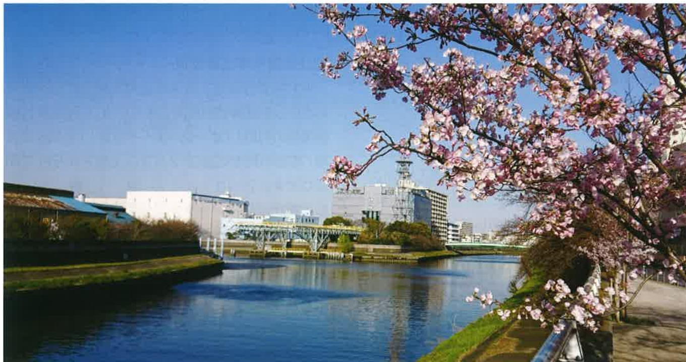
新河岸川河畔の桜（3月24日撮影）

発行：一般社団法人 板橋産業連合会 板橋区仲宿5-4-10 ☎(3962)0131 FAX(3962)0133 http://itabashisanren.org