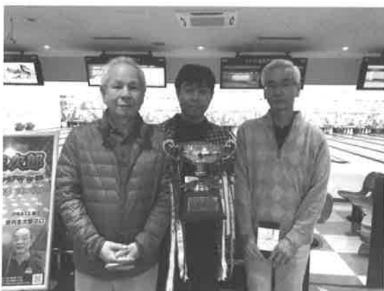
団体の部優勝の新日鐵住金Bチーム