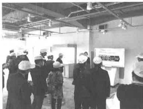
先端的な取り組みの説明を聞く参加者

環境視点での「創る」「続ける」「魅せる」の三つの機能を併せ持つ同センターは、従来主流だった環境配慮型製品の提供に止まることなく、地球環境の未来を見据えた環境事業創出の最先端基地であり、参加者の皆さんは時間が経つのも忘れ興味深く施設内を見学していました。