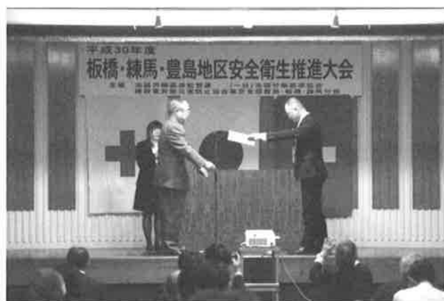
(株)東京システック 様