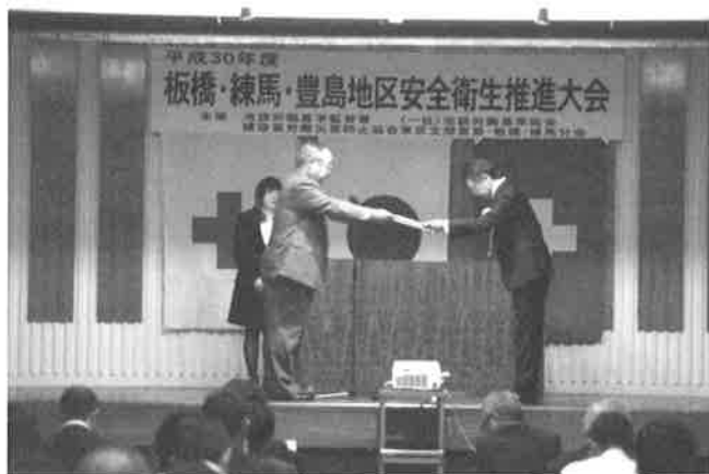
(株)サイトウ製作所 様