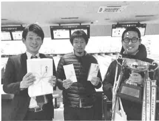
団体優勝 GIKODOZチームの皆さま