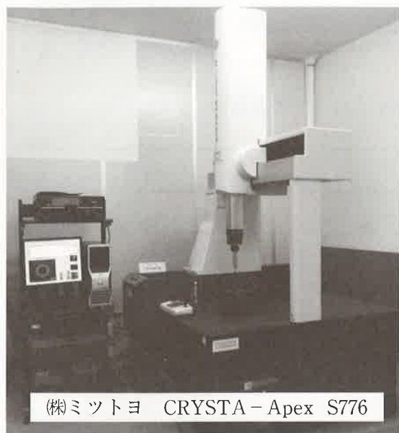
(株)ミットヨ CRYSTA-Apex S776

～ 板橋区 産業振興課活性化戦略Gからのご案内 ～ 概要： 本体、プローブ、データ処理装置で構成されています。