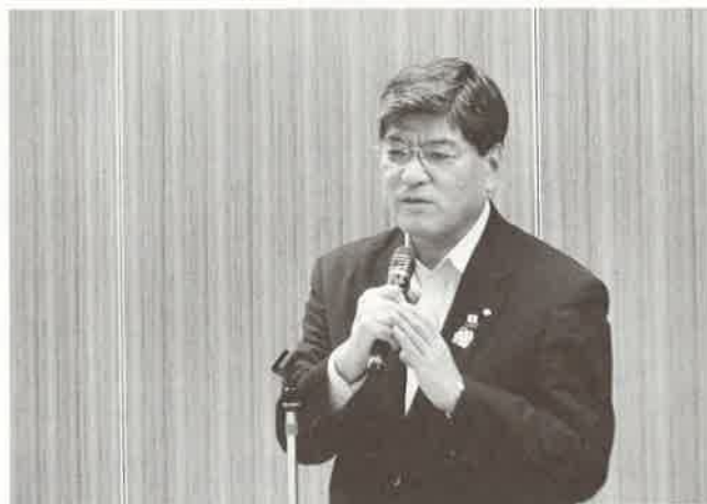
ご祝辞 坂本 健 板橋区長