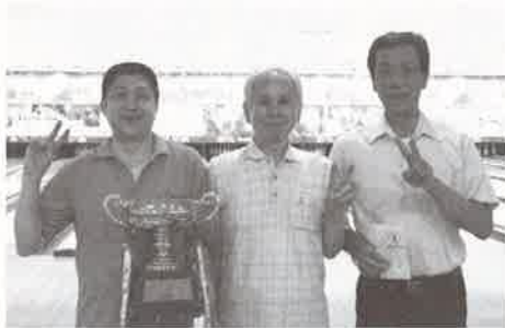
優勝 新日鐵住金チーム