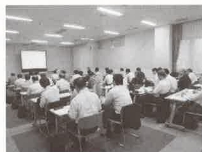
前回セミナーの様子

板橋区のものづくり企業の企業継続力を強化します。BCPとは、企業が緊急事態（自然災害、大火災、感染症）に遭遇した場合において、事業資産の損害を最小限にとどめつつ、中核となる事業の継続あるいは早期復旧を可能とするための方法、手段をあらかじめ取り決めたものです。BCP策定は、自然災害等のリスクへの備えになるだけでなく、平時における業務の見直しにもつながり、企業の経営力を高めます。また、その取組を取引先にアピールすることで、企業の信用力の向上にもつながります。BCPとはなにか。BCPというの聞いたことがあるが、何から始めればいいのか分からない。という声にお応えします。「簡易型」の名前のとおり、時間も手間もかけずにBCPが策定できるのが板橋区簡易型BCPですので、ぜひ一度セミナーにご参加ください。