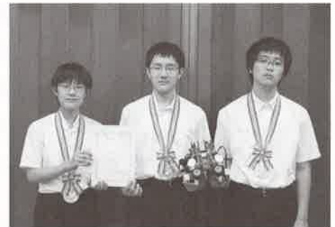
最優秀賞 千葉中学校 科学部チーム