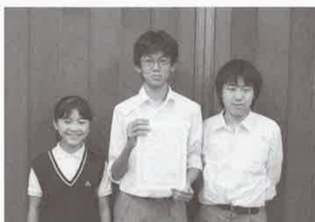
奨励賞 赤塚第三中学校パソコン部Aチーム