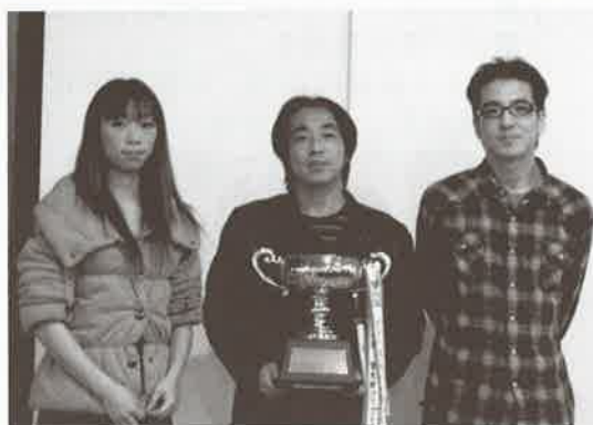
優勝 新日鐵住金Bチーム