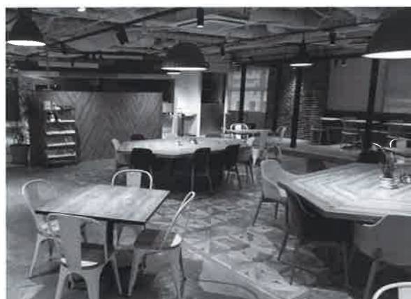
木の風合いを生かしたリラックス空間 (TOK)

志村支部では11月1日(金)に18名のご参加をいただき、志村支部会員企業の(株)TOK様の東京オフィスを見学させていただきました。見学後はみかど旅館にて懇親会を行いました。