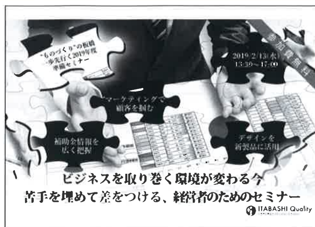
画像は2019年準備セミナー開催時のものです。

異なるテーマを3部構成で開催します。興味のあるテーマだけの参加もOKです。ぜひご参加ください。