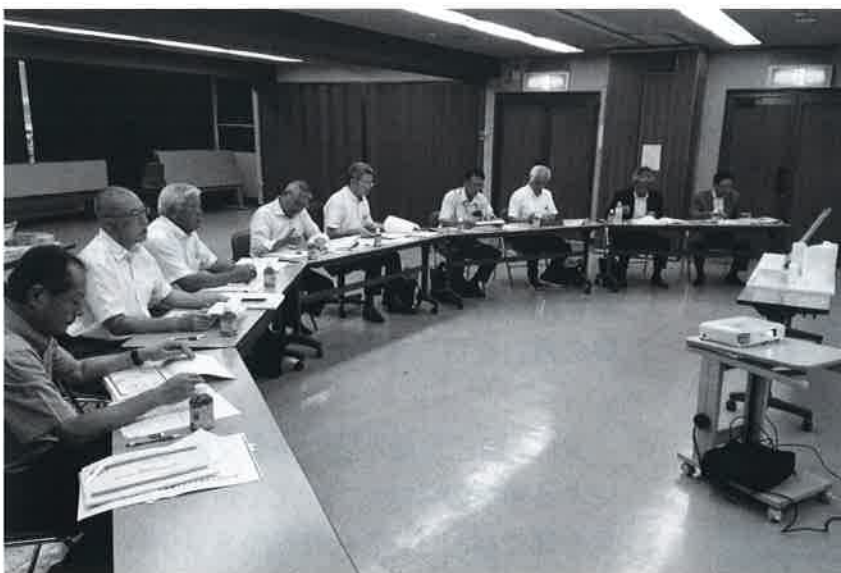
令和元年8月21日 審査会風景

このような不確実な状況のまま、会員事業者等に協力いただき計画案作成を進めたとしても、資金計画の裏付けがない計画（設計）は”絵に描いた餅”に過ぎず、金融機関から融資不適格あるいは減額と判断されたときには、この間の作業・労力はもとより、建設計画自体がとん挫することを覚悟しなければならない。また、この場合には、事業者の選定にあたって競争が働く余地がないなど、公正な事業者選定が不可能である点も課題とされた。