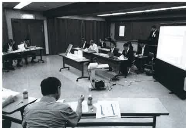
令和元年8月21日 プレゼンテーション風景

提案説明は2者が競合しないよう時間を分け、各審査員が9項目のチェック項目ごとに評価点を記入する方法で実施した（1人200点満点）。