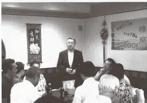
大島産連会長の挨拶