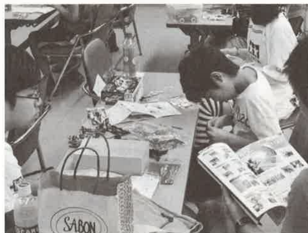
ミニ四駆組み立ての様子