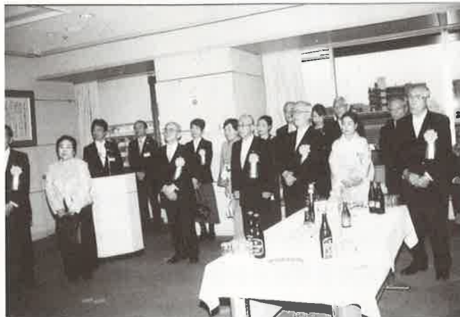
吉川会長はじめ区政功労者の皆さま