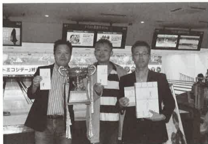
優勝された 日経印刷(株)の皆さま