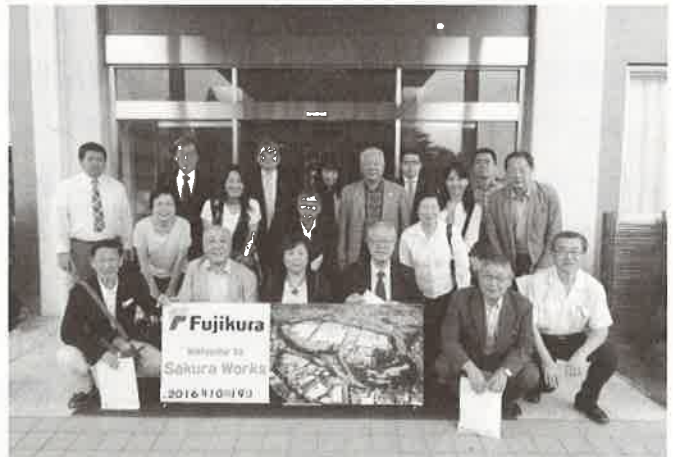
株式会社フジクラ佐倉事業所前にて