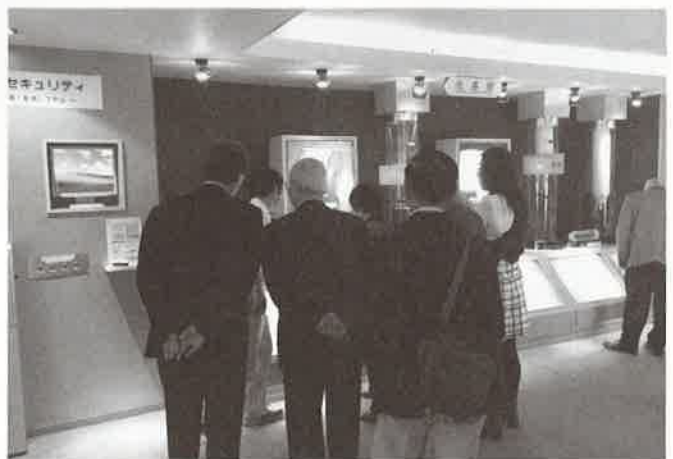
株式会社フジクラ佐倉事業所展示室