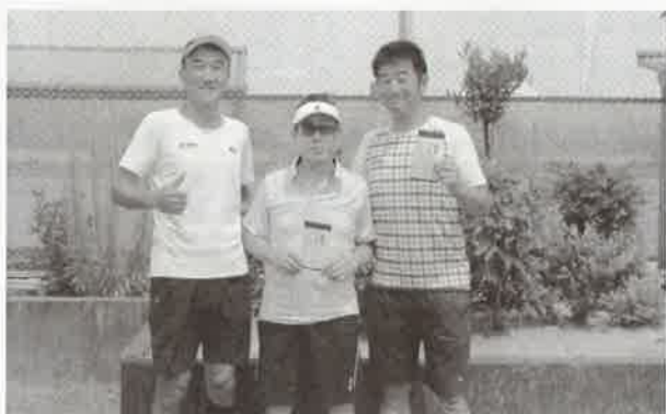
男子ダブルス 優勝 ルオレンA (左右) 準優勝 ルオレンB (中央)