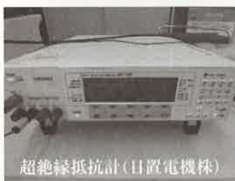
超絶縁抵抗計（日置電機株）