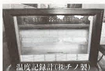
温度記録計（株チノ製）