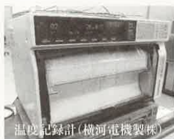
温度記録計（横河電機製）

本シリーズでは、板橋産業技術支援センターの設備を順次紹介していきますので、切り抜いて保管していただきますと、お役に立つかと思えます。