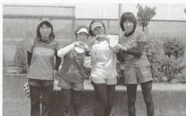
女子ダブルス 優勝 NSSMC A (右) 準優勝 ルオレンB (左)