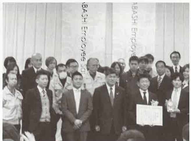
(株)技光堂様 受賞の様子