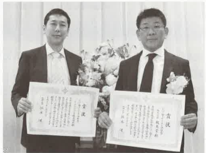
トックベアリング(株)様 (株)技光堂様

社員満足度調査を基礎とした専門家による審査をもとに、更なる飛躍が期待できる元気な企業等が表彰会社を選出する基準になります。平成27年度いたばし働きがいのある会社賞では、板橋産業連合会会員企業であるトックベアリング株式会社、株式会社技光堂を含めた3社が受賞されました。