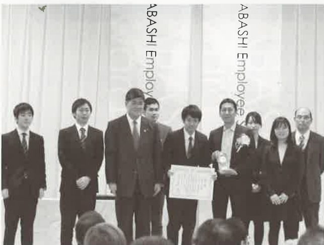
トックベアリング(株)様 受賞の様子