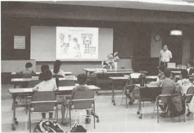
入門クラス 講習会の様子

さる、平成27年8月6日(木)小中学生を対象とした板橋産連ミニ四駆大会が開催されました。当日は入門クラス、応用クラス合計18名のご参加をいただき板橋産連会館3階会議室にて行われました。