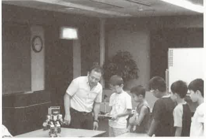
入門クラス ロボットを操作している様子

つづいて行われました応用クラスは、応用クラス用の機体を作成しました。こちらはミニノコギリ等の工具を使用して追加パーツを組み込んで作成し、ブレーキやダンパー等入門より高度なセッティングが速さに影響して、より白熱したレースが展開されました。