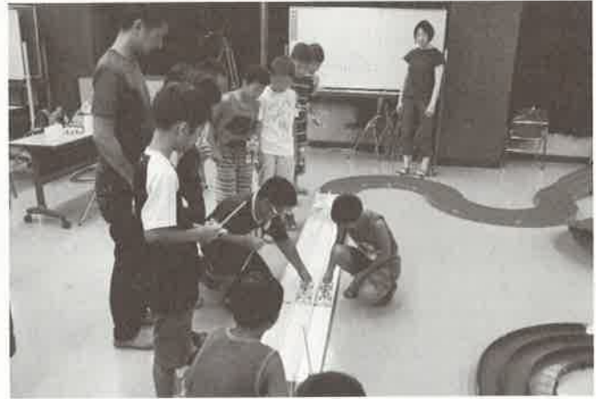
レースの様子 その2