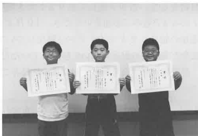
入門クラス 入賞者