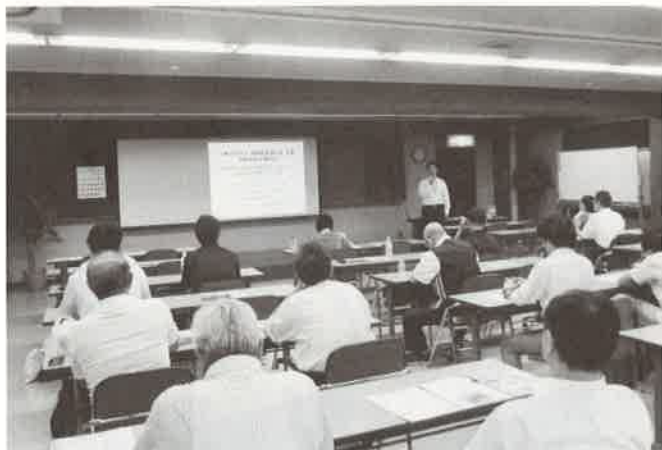
自転車安全講習会の風景

通勤等事業場での自転車利用の機会も多いかと存じます、自転車事故を未然に防止するため周知徹底し、各事業場で自転車の安全な運転について今一度見直しをお願いいたします。