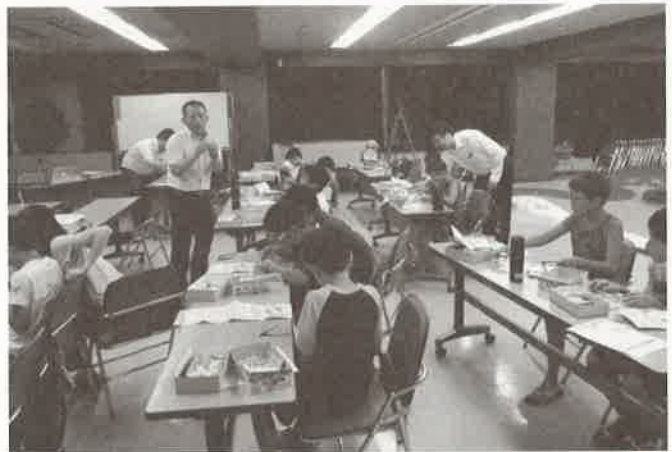
入門クラス 機体製作の様子