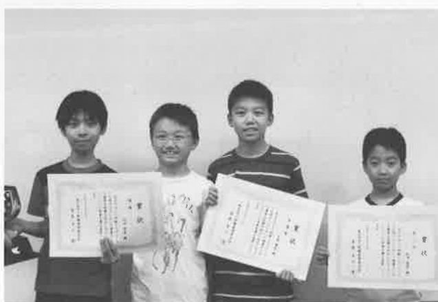
応用クラス 参加者