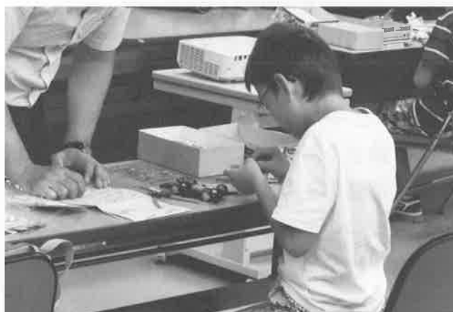
応用クラス 機体製作の様子