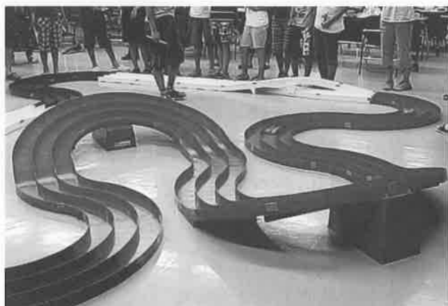
レースの様子 その3