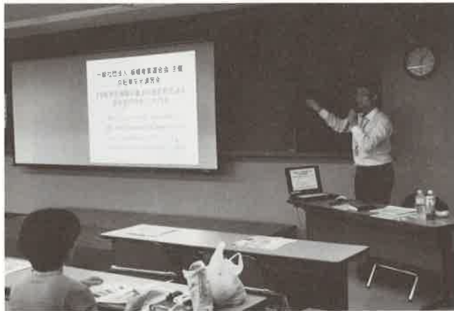
自転車安全講習会の風景