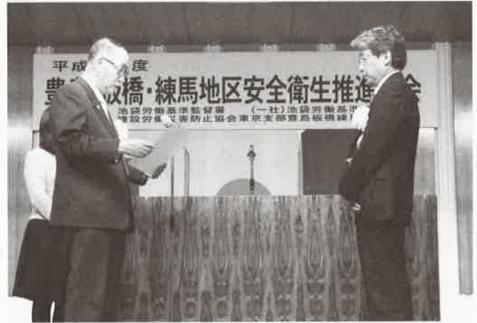
池袋労働基準協会会長賞 長江建材工業株式会社