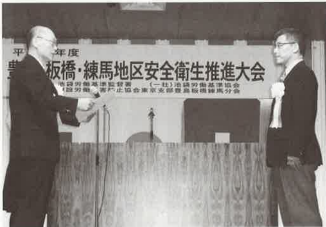
池袋労働基準監督署長賞 株式会社トッパンテクノ

板橋地区では会員であります(株)トッパンテクノが池袋労働基準監督署長賞を受賞されました。また、長江建材工業(株)、東京都プリプレス・トッパン(株)が池袋労働基準協会会長賞を受賞されました。