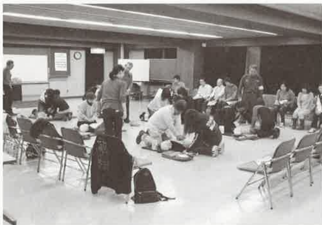
当日の会場の様子

11月10日(月)板橋産連会館3階にて救急救命講習が開催されました。今回の講習では板橋消防署にご協力いただき、公益財団法人 東京防災救急協会にご指導いただきました。当日は27名の方にご参加いただき、緊急時の救命措置の方法(心肺蘇生法の手順とAEDの使用法)を学んでいただきました。