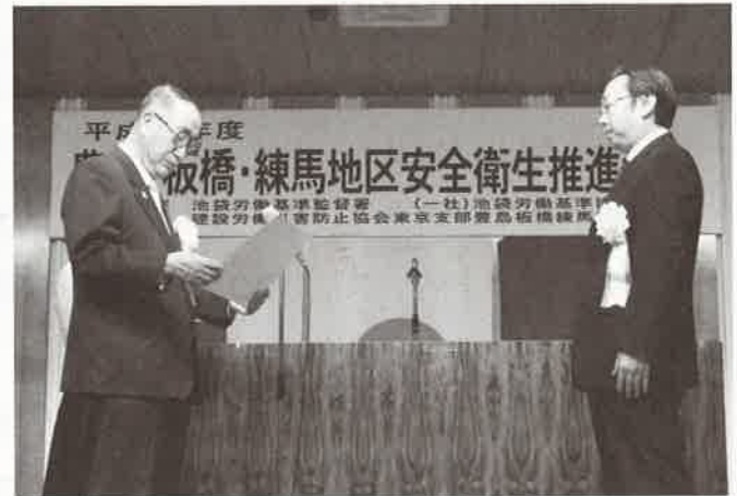
池袋労働基準協会会長賞 東京都プリプレス・トッパン株式会社