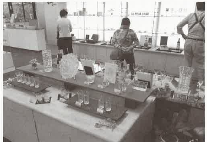
カガミクリスタル展示場販売場