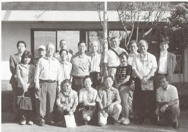
カガミクリスタル(株)前での集合写真