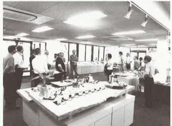
カガミクリスタル展示場での説明 (工場内は残念ながら撮影禁止でした)

参加者の中には展示販売で気に入ったクリスタルガラスを購入された方もいらっしゃいました。