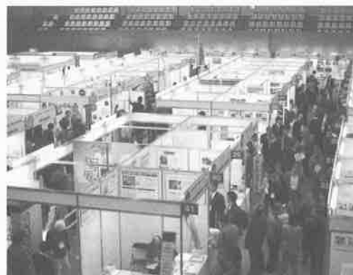
今年の会場の様子