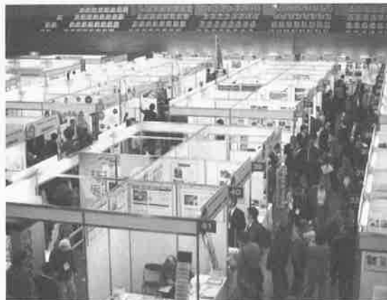
いたばし産業見本市 昨年の会場風景

いたばし産業見本市の会期2日目、同会場で「平成26年度 板橋区企業情報交流会」を開催します。“ものづくり企業商談会”“開発・研究マッチング会”“技術移転セミナー”の3つのプログラムで、製造業の企業の販路拡大・企業間ネットワーク構築、より付加価値の高い開発を応援します。