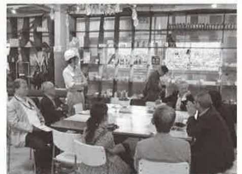
マテリアル(素材)を使った作品、商品

参加者からは様々な質問が飛び交い、工場内を熱心に見学しました。この中間処理場でリユースされる資源(材料)は東急ハンズにも卸しているものもあるそうです。廃棄物の再資源化もちょっとした分別や、まとめ方により大きく価値が変わる事がわかり、参加者もしきりに感心していました。