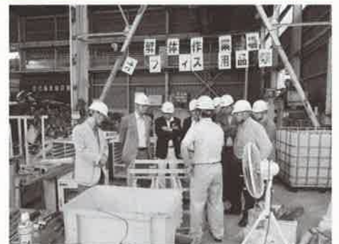
廃棄物処理場内 解体作業場の様子