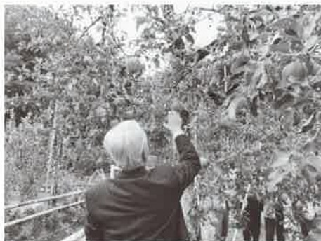
りんご狩りの様子（原田農園）