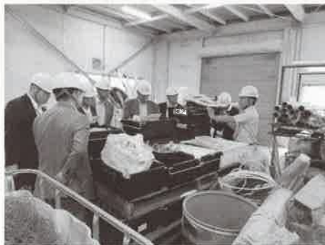
マテリアルライブラリー内の様子

今年度の工場見学視察研修会として、10月4日、5日に群馬県前橋市にある株式会社ナカダイモノ：ファクトリーの産業廃棄物中間処理場を訪問しました。金属類やプラスチック、木屑など様々なものを機械や手作業で分別し資源としてリサイクルする過程やリユースされる資源を見学しました。