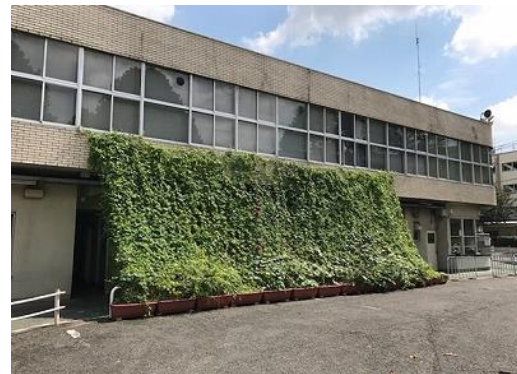
団体部門：凸版印刷(株)板橋工場