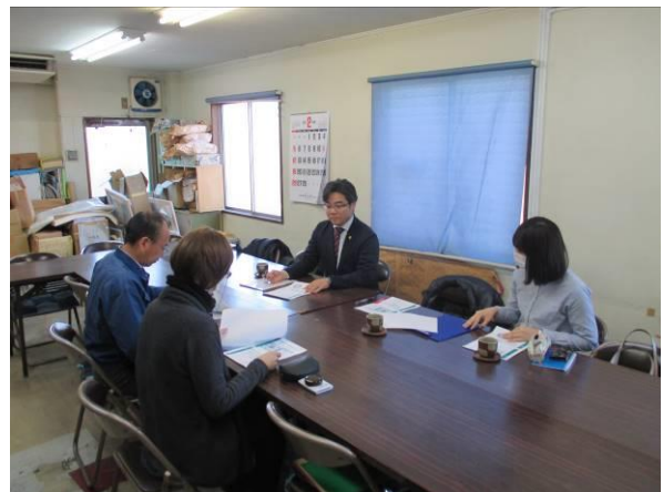
訪問セミナーの様子