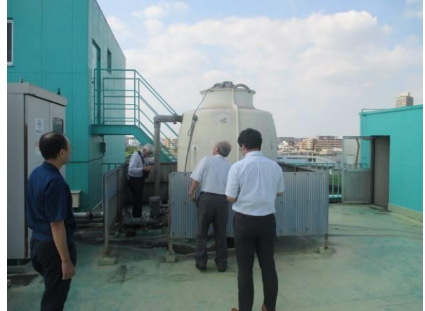
省エネルギー診断の様子

省エネルギー診断に基づく改善策に、実情に応じた最適な優先順位の提案など、実行に向けたサポートを行います。また、取組効果の検証方法のほか、改善策の実行に不安や課題等を抱えている場合は、解消に向けた可能な限りのサポートも行います。