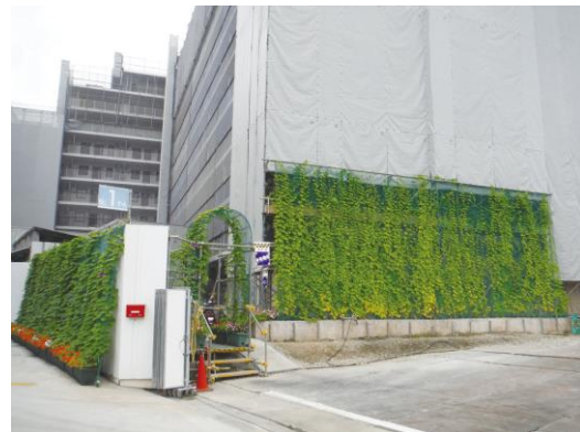
団体部門:三井住友建設(株)東京建築支店 (仮称)板橋区蓮根3-26計画作業所