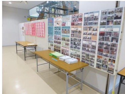
パネル展示の様子