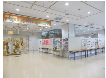
展示ホールの様子