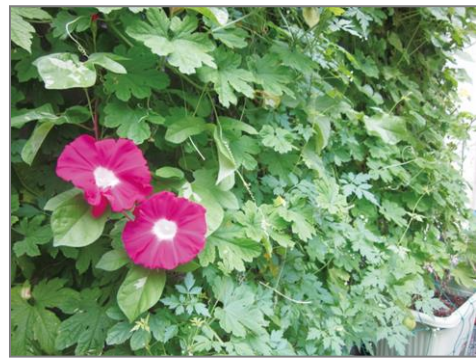
団体部門:共同総業株式会社