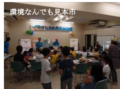
環境なんでも見本市