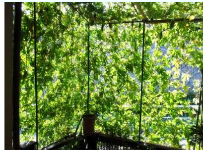
平成26年度 個人部門グランプリ 伊東 優次 様

◆提出・問合せ 板橋区立エコポリスセンター 〒174-0063 板橋区前野町4-6-1 電話:03-5970-5001 Eメール:info@itbs-ecopo.jp