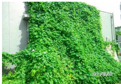
平成26年度 団体部門グランプリ 富士見団地自治会 様