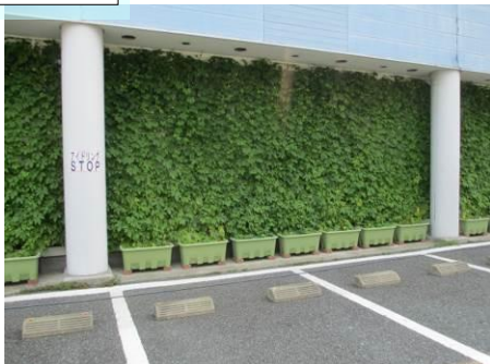
平成25年度 団体部門グランプリ GOLF PLAZA ジョイジョイ蓮根 様