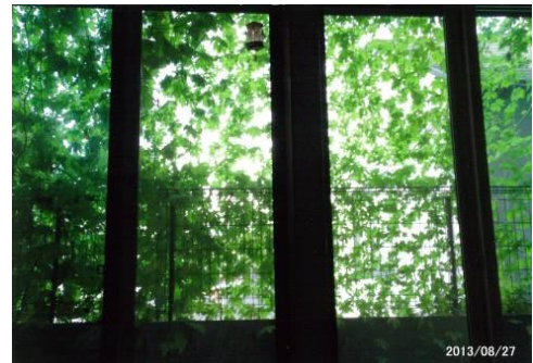
平成25年度 個人部門グランプリ 是川 由里子 様

◆提出・問合せ 板橋区立エコポリスセンター 〒174-0063 板橋区前野町4-6-1 電話:03-5970-5001 Eメール: info@itbs-ecopo.jp