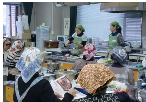
エコ・クッキングの様子

11月19日(火)(必着)までに、はがき・FAX・Eメールで環境戦略担当課環境協働推進担当係まで。