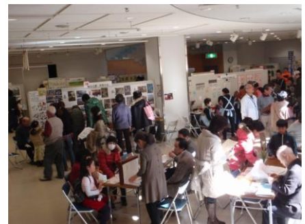
昨年度の会場の様子