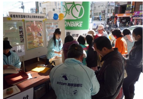
エコライフフェアの様子