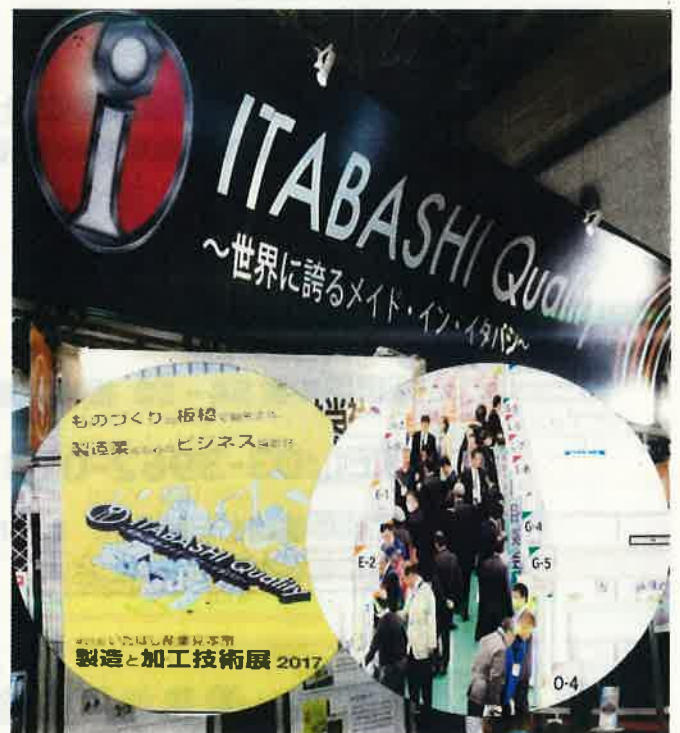
第21回いたばし産業見本市 2017年11月9、10日開催 板橋区立東板橋体育館